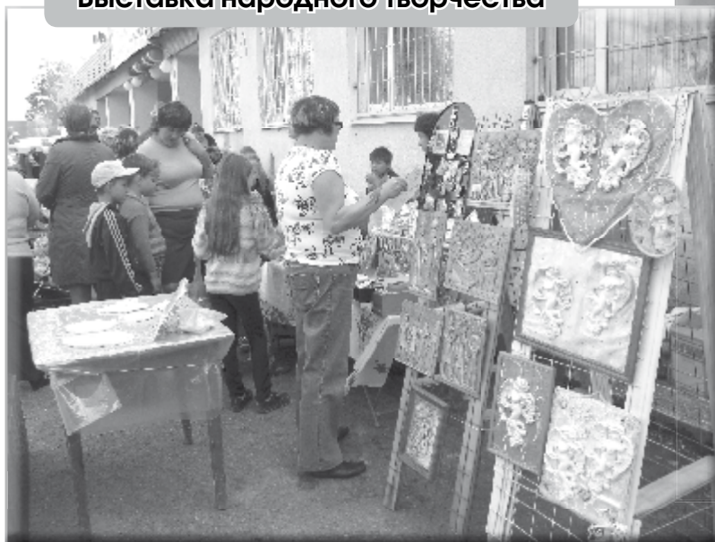
Выставка народного творчества