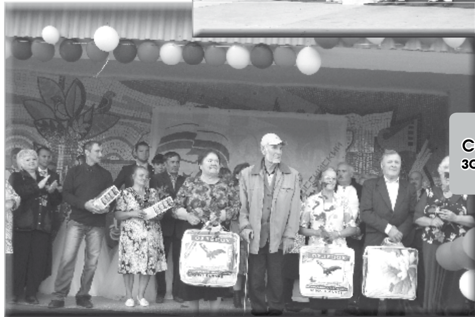
Семейные пары - золотые юбиляры