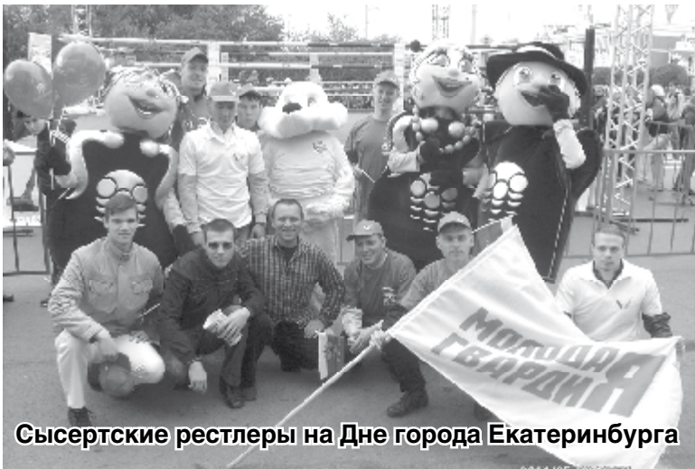
Сысертские рестлеры на Дне города Екатеринбурга