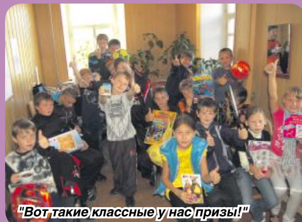
"Вот такие классные у нас призы!"

Юлия Воротникова.