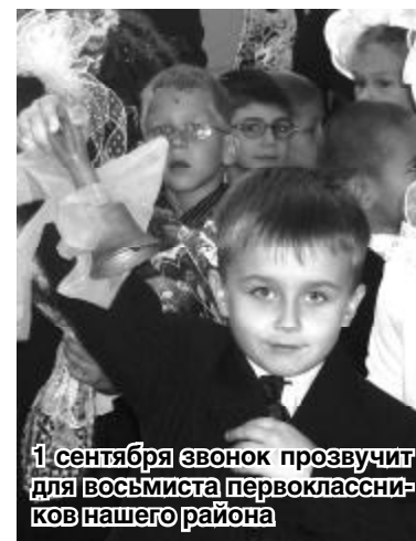
1 сентября звонок прозвучит для восьмиста первоклассников нашего района