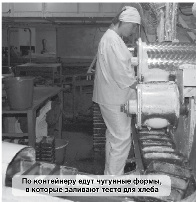
По контейнеру едут чугунные формы, в которые заливают тесто для хлеба

Директор убежден, что людям нужны не какие-то дополнительные гарантии для от-