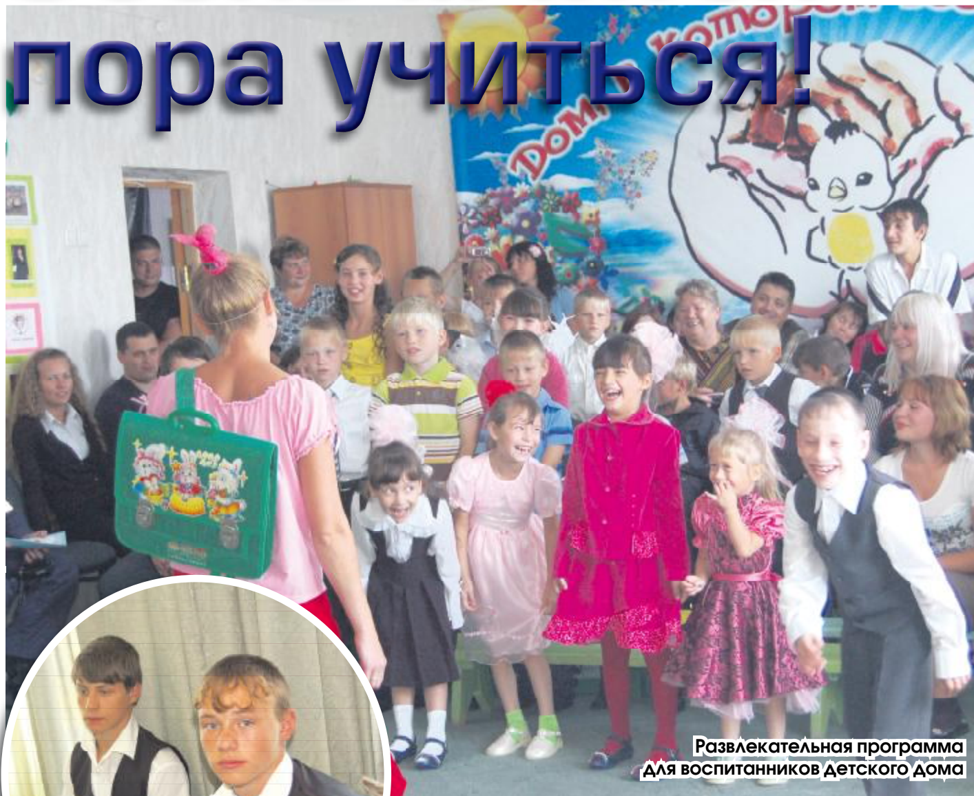
Развлекательная программа для воспитанников детского дома