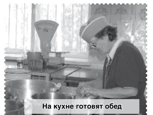
На кухне готовят обед

- Они ведь и, став взрослыми, по уровню своего развития остались детьми. Был случай, когда выпускнику государство дало квартиру стоимостью миллион рублей, а он тут же продал ее за 30 тысяч и остался на улице... Хорошо, в этом вопро-