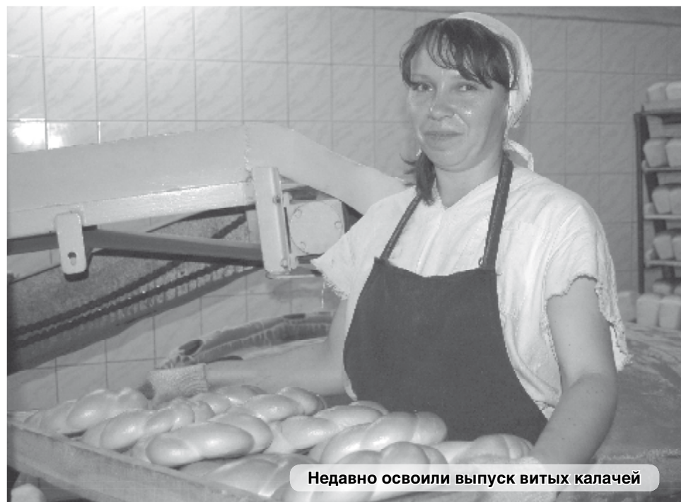
Недавно освоили выпуск витых калачей