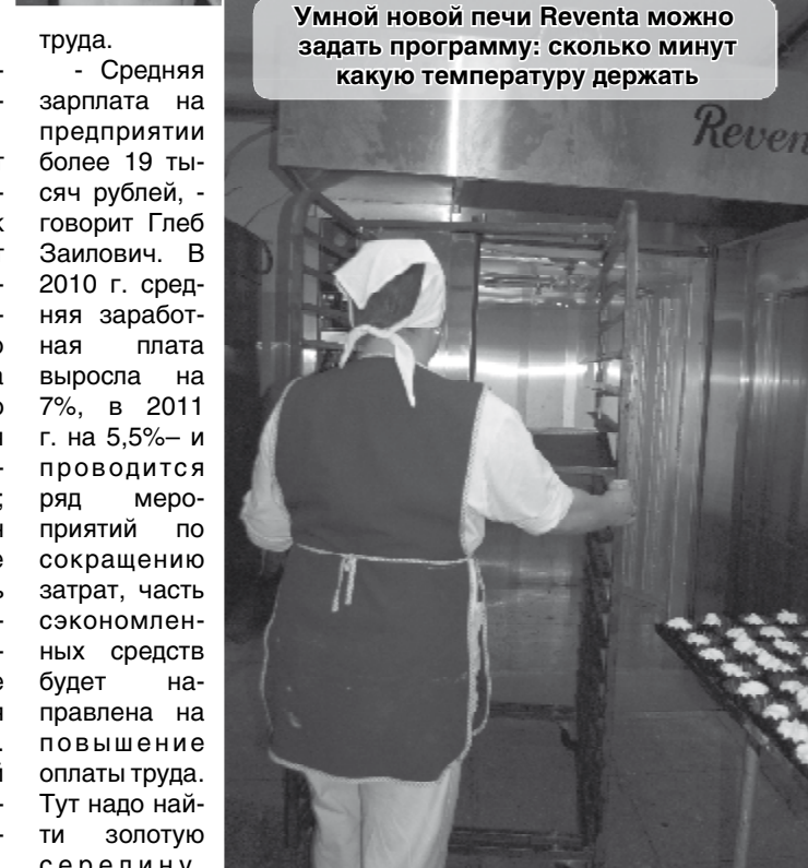
Умной новой печи Reventa можно задать программу: сколько минут какую температуру держать