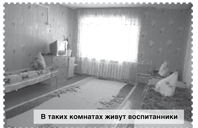
В таких комнатах живут воспитанники