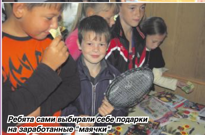
Ребята сами выбирали себе подарки на заработанные "маячки"

С незатейливой ношей в руках, с ясными, честными глазами, с одним и тем же вопросом они обращались ко всем встречным прохожим. Мужчинам и женщинам, молодым и пожилым эти ребята предлагали купить газету «Маяк». В течение июля и августа редакция газеты совместно с комитетом по делам молодежи администрации Сысертского округа провели акцию под названием «Большая игра».