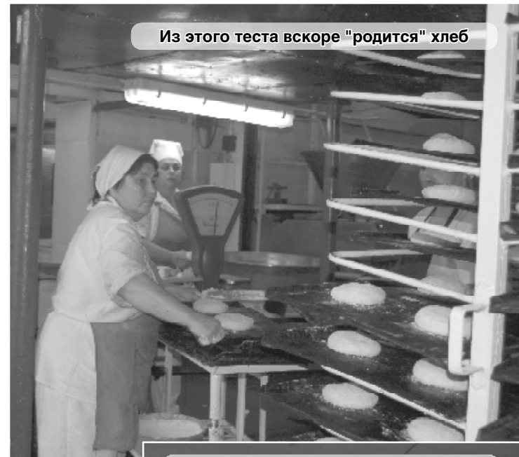
Из этого теста вскоре "родится" хлеб

Зарплата выдается вовремя, полностью выплачиваются предусмотренные налоги и отчисления на фонд оплаты