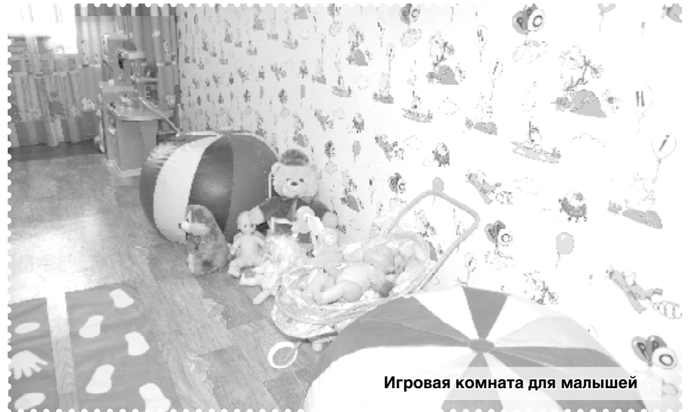
Игровая комната для малышей

Да, у ребят есть свои деньги. Некоторым перечисляют алименты с родителей, плюс пенсия по инвалидности. Они аккумулируются на банковских