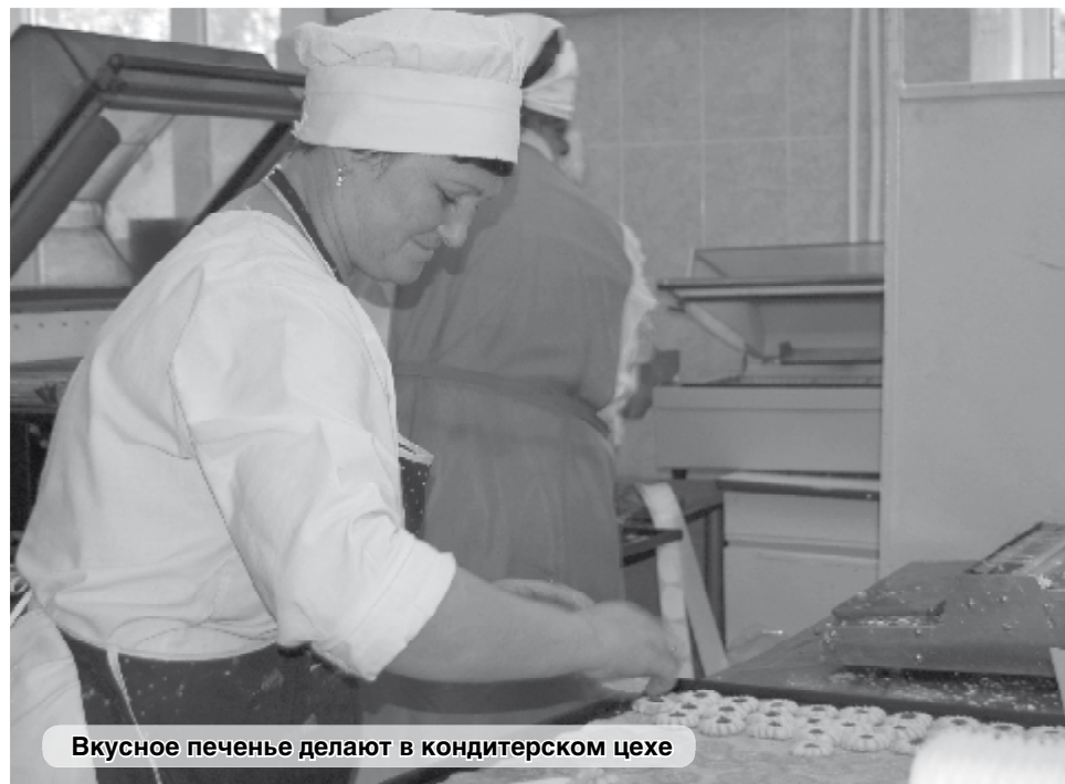
Вкусное печенье делают в кондитерском цехе