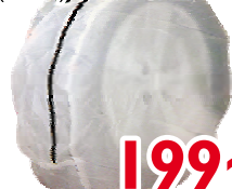
Чехлы для переноски и хранения колес 13-17" (4 шт.) NEW GALAXY