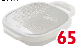
Набор терка + контейнер, VETTA