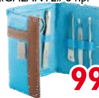
Набор маникюрный «GALANTE» 6 пр.