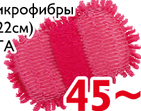
Губка для уборки из микрофибры (12x22см) VETTA