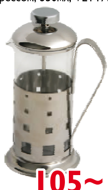
Кофейник стальной с прессом, 350мл, VETTA