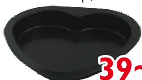
Форма для выпечки сердце 23x22см с а/покр., VETTA