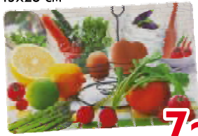
Салфетка пластик 43x28 см

Тысячи полезных вещей для Вашего дома по низким ценам!