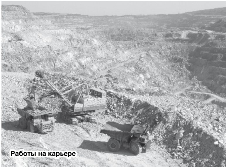
Работы на карьере