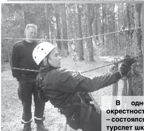
В одном из красивейших мест окрестностей Сысерти – в урочище Паново – состоялся в субботу очередной районный турслет школьников.