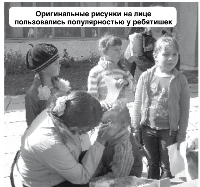
Оригинальные рисунки на лице пользовались популярностью у ребятишек