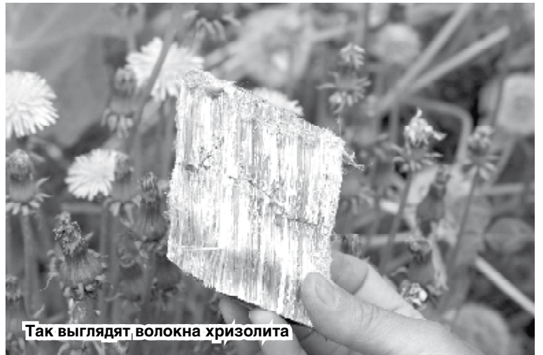
Так выглядят волокна хризотила

Кислотоустойчивые асбесты амфиболовой группы, попадая в легкие человека, могут долго находиться и накапливаться в них. Волокна хризотилового асбеста