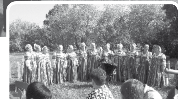
Выступает хор ветеранов