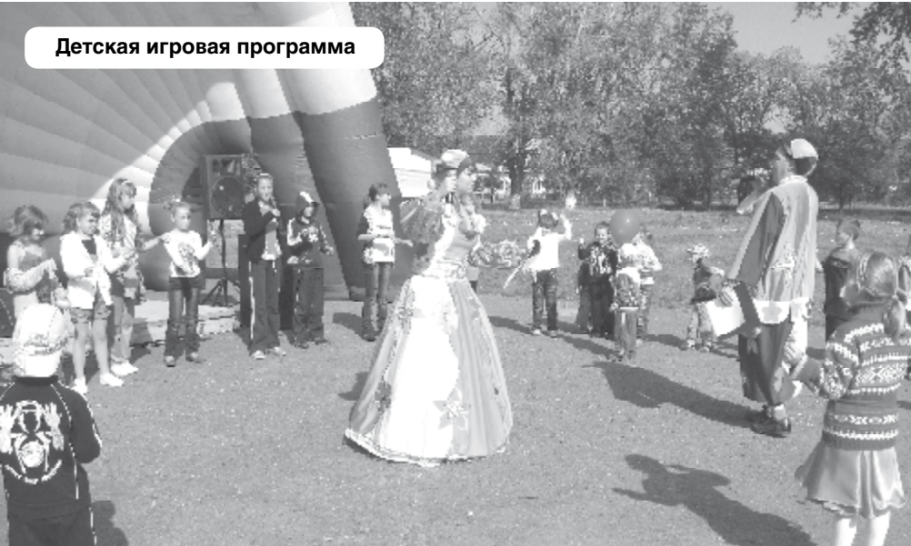
Детская игровая программа