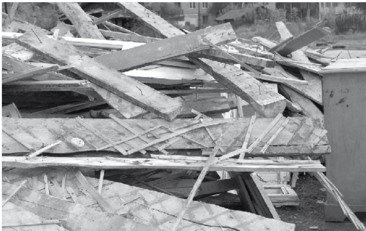
В доме N11, что по улице Орджоникидзе в Сысерти, кто-то приобрел квартиру и делает ремонт. И то, и другое, конечно, прекрасно. Но весь хлам – старые рамы, двери, доски... новый хозяин вынес на улицу и вывозить это, похоже, не собирается. Куча растет уже две недели, скоро к мусорным контейнерам не подойти будет. Кроме того, так и до пожара недалеко.