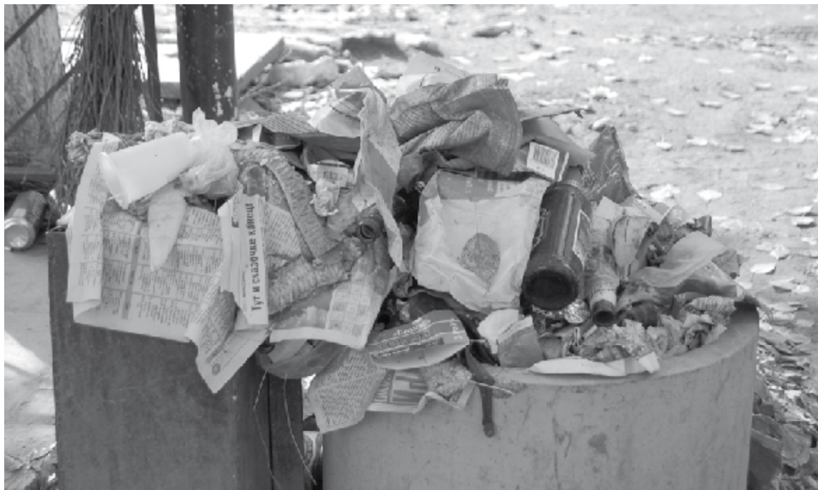
Стихийный рынок на улице Орджоникидзе нам очень нравится. Здесь можно купить у бабушек домашние помидоры и огурцы, свежий лучок и салатик... К сожалению, места для этих бабушек никак не обустроены, а вечерами на стоящих рядом скамеечках «отдыхает» и молодежь. Конечно, отсюда и бутылки в урне и рядом, и картонные ящики, и прочий мусор.