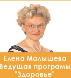
Елена Малышева Ведущая программы "Здоровье"