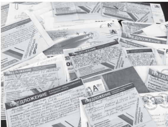
Тысячи уральцев прислали свои предложения в Народную программу

Впрочем, добавляет Петров, важно еще и чтобы те, кто вносил предложения, теперь участвовали в реализации проектов: «Конечно, проще сказать: «Постройте садик». Но мне бы очень хотелось, чтобы те, кто вносит предложения в программу, участвовали