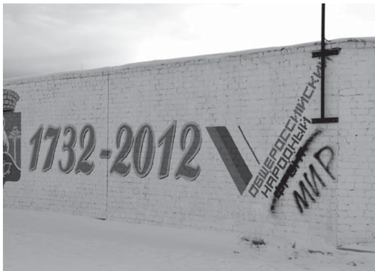
«попортил» в принципе красивый рисунок на стене около военкомата в Сысерти? Идея, между

Видимо, так думаю не только я. Посмотрите на фото. Кто так