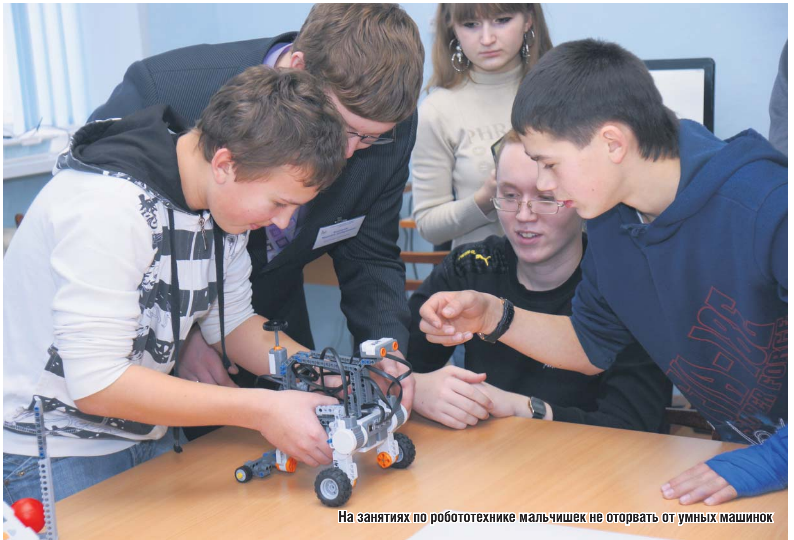
На занятиях по робототехнике мальчишек не оторвать от умных машинок