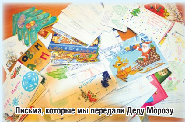
Письма, которые мы передали Деду Морозу