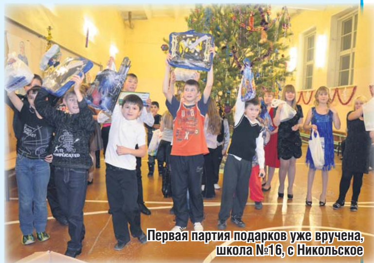
Первая партия подарков уже вручена, школа №16, с Никольское

От редакции. Доставить ваши письма Деду Морозу нам помогли МУП ЖКЖ «Сысертьское» и завод «Умекон».