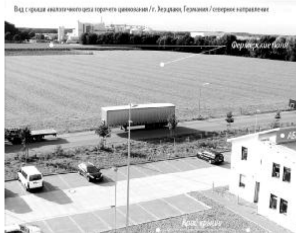
Так выглядит земля вокруг цеха горячей оцинковки в немецком городе Херцлаке. В 50 метрах от цеха - фермерское хозяйство.