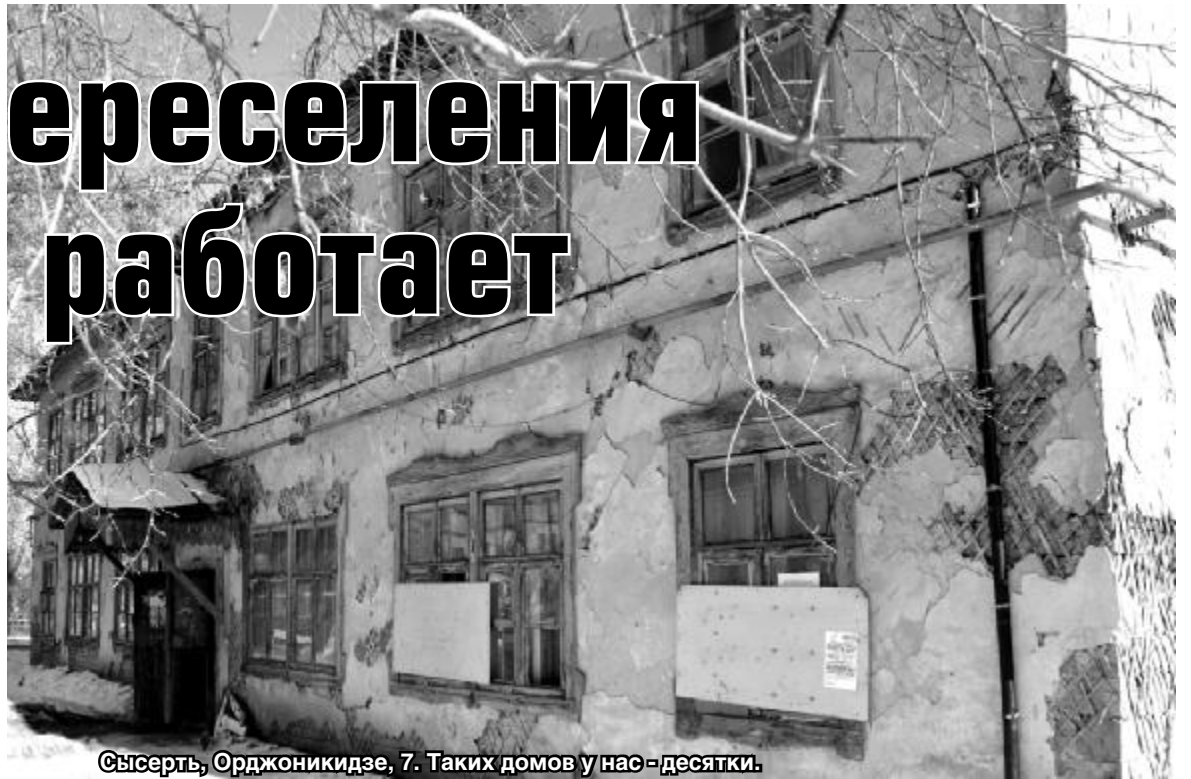
Сысерть, Орджоникидзе, 7. Таких домов у нас - десятки.

8 февраля в «Маяке» опубликовано письмо жительницы Сысерти Т. Гладышевой. Своё видение проблемы излагает сегодня прокуратура.