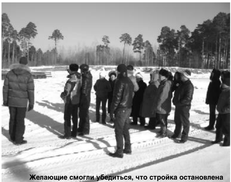
Желающие смогли убедиться, что стройка остановлена