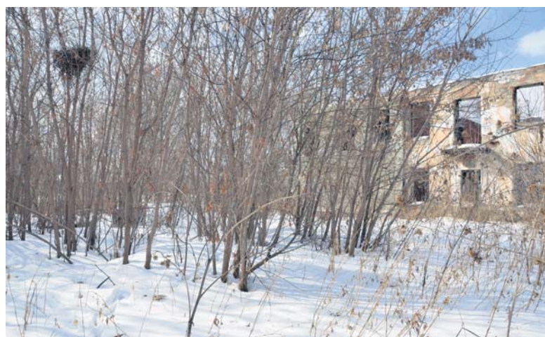
А во дворе - репей и клены