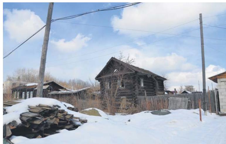
Следующий дом - пустой, ул. Большевиков, 46