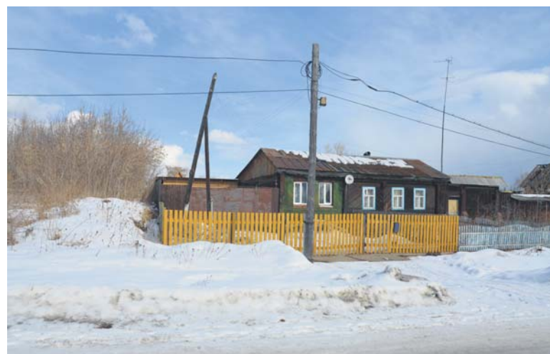
Соседний дом - ул. Большевиков, 48