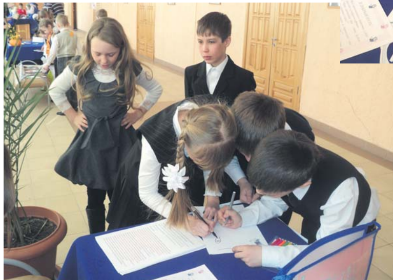
Конкурсанты из Бобровского в красках описывают, как нужно делать утреннюю зарядку