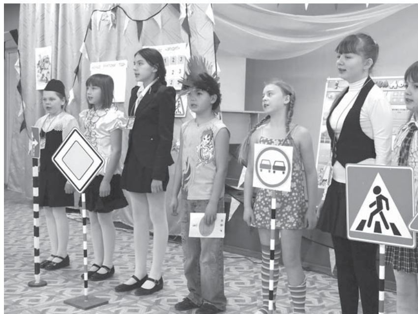
НА СНИМКЕ: кашинские школьники знают дорожные знаки на отлично!

В рамках проведения профилактических мероприятий «Внимание, каникулы!» в школе N 8 прошел конкурс «Эрудит». Школьники изучали правила дорожного движения, собирали мозаику дорожных знаков. Больше всего в конкурсе ребятам понравилась эстафета, в которой нужно было правильно расставить слова, как например: «пешеходный переход», «дорожное движение». По окончании конкурса инспектор по пропаганде отделения ГИБДД вручил участникам почетные грамоты и памятки юного пешехода.