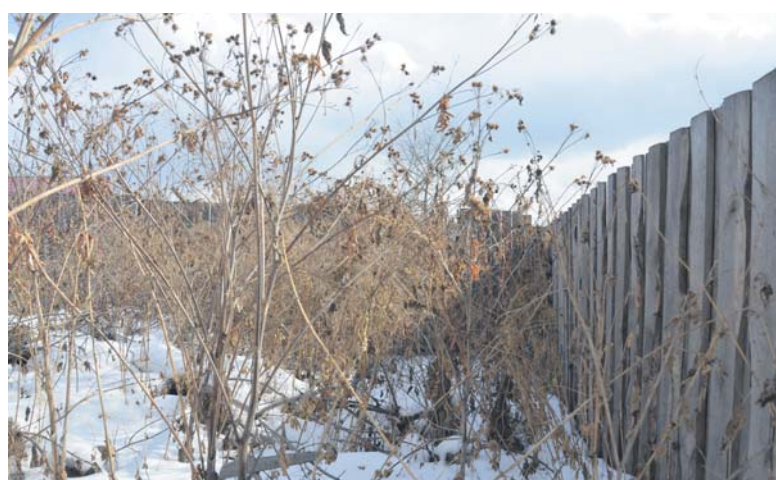
За этим забором был пришкольный участок