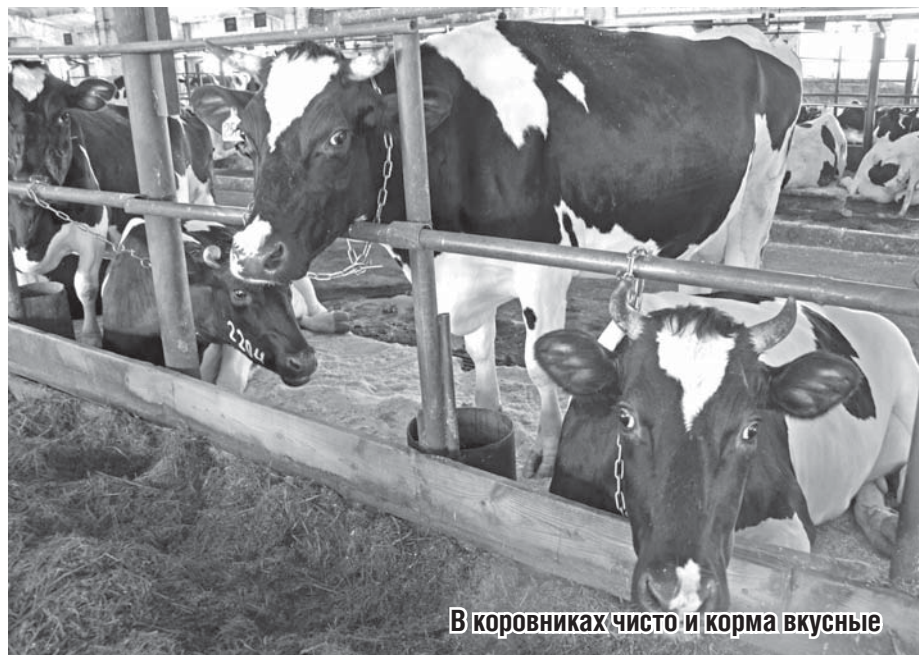
В коровниках чисто и корма вкусные