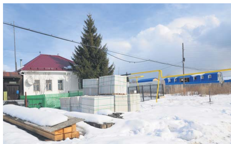
Большевиков, 44 - угловой дом

меньше 70 соток. Не хватает 30 с лишним соток.