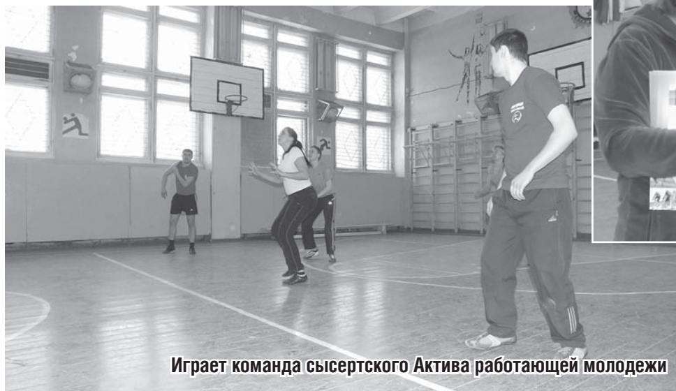
Играет команда сысертского Актива работающей молодежи