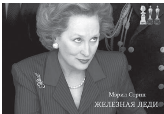
Мэрил Стрип ЖЕЛЕЗНАЯ ЛЕДИ

В этот раз зрителю придется постоянно сражаться с флешбэками – возвращениями в прошлое и обратно. Перед нами не только блистательная женщина-политик, но и благообразная старушка, о былой жизни которой напоминает лишь множество известных фотографий на стенах печально опустевшего дома. Постаревшая Маргарет (Мерил Стрип) окружена заботой, но предельно одинока – вот уже три года она живет без мужа Де-