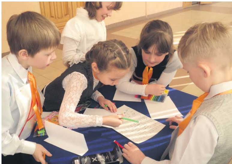
Команда «Витаминчики» из школы №7 пытается разгадать замысловатый ребус

баллам. Свои оценки по заочной части конкурса жюри выставило еще до того, как школьники собрались в этом зале. Семь команд подготовили отчеты о выполнении экологических проектов и заранее отправили их организаторам — в Центр детского технического творчества. Авторы лучших работ и были приглашены на очный тур «Экоколобка». По итогам