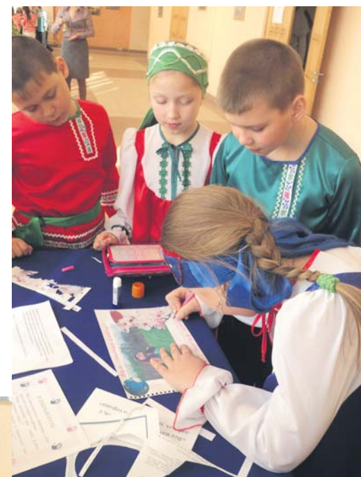
Ребята составляют мини-плакат на экологическую тему

двух туров ученики бобровской школы №13 заняли третье место, ребята из патрушевской школы №7 стали вторыми. Малышей из большеистокской 11-й школы наградили грамотами за участие. Победители же районной игры — второклассники 23-й школы под руководством М. В. Деменьшиной — отправятся на областной этап, который проходит традиционно 22 апреля в День Земли.