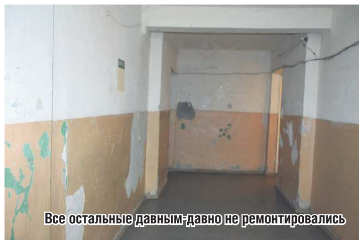
Все остальные давным-давно не ремонтировались