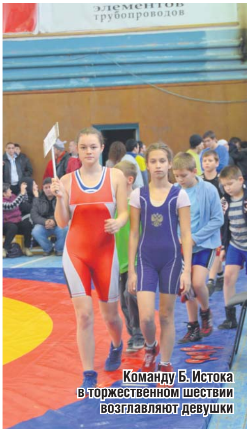
Команду Б. Истока в торжественном шествии возглавляют девушки

Юлия Воротникова.