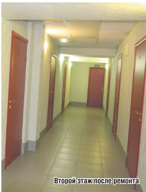
Второй этаж после ремонта