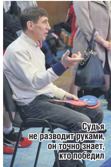
Судья не разводит руками, он точно знает, кто победил