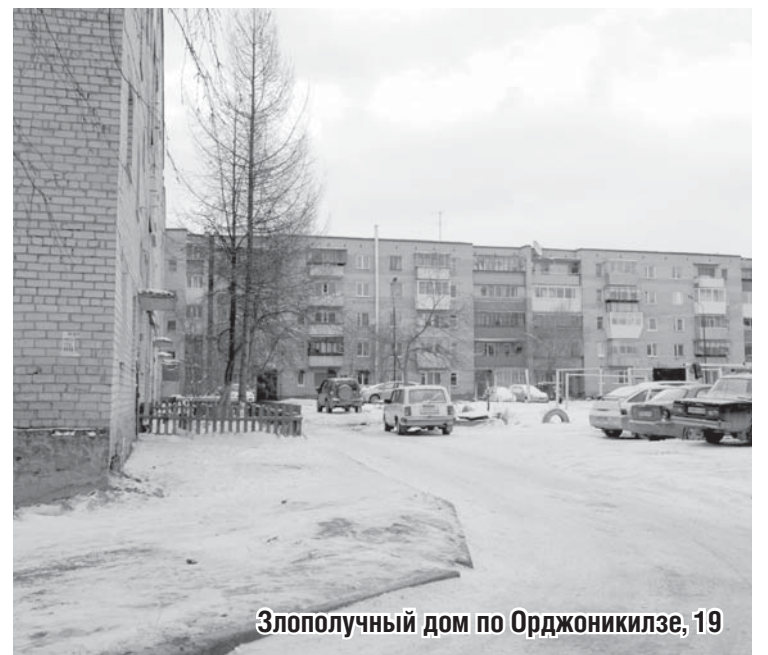
Злополучный дом по Орджоникидзе, 19

Подготовила Наталья Беляева.