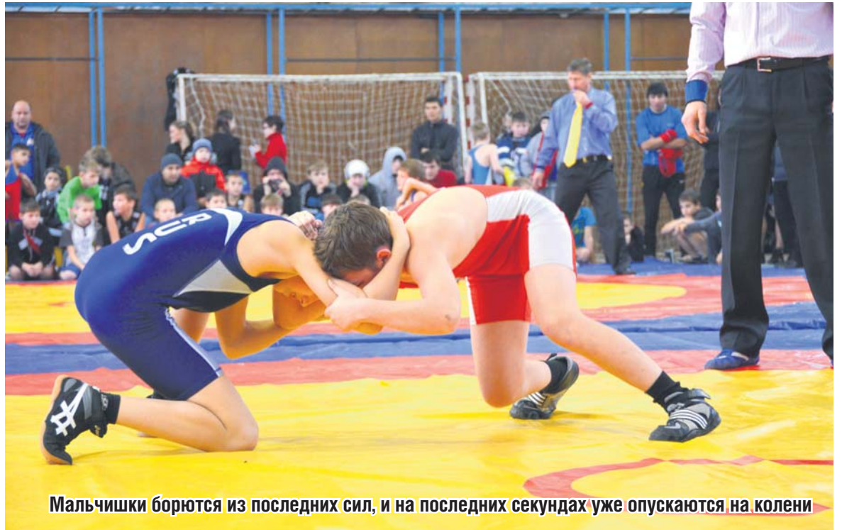
Мальчишки борются из последних сил, и на последних секундах уже опускаются на колени

- Я пришел на борьбу, чтобы уметь защищаться, если на меня нападут. Мне нравится