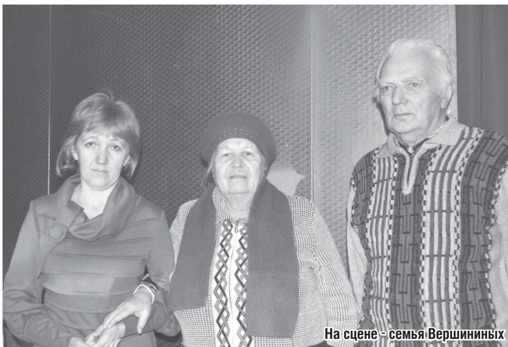
На сцене - семья Вершининых