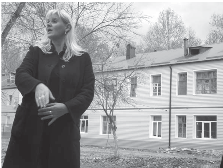
Два соседних дома. На одном еще видны темные следы затопления, второй «упакован» в сайдинг