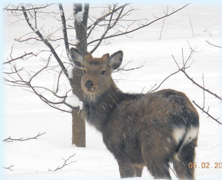
Серебряное копытце и Кокованя.