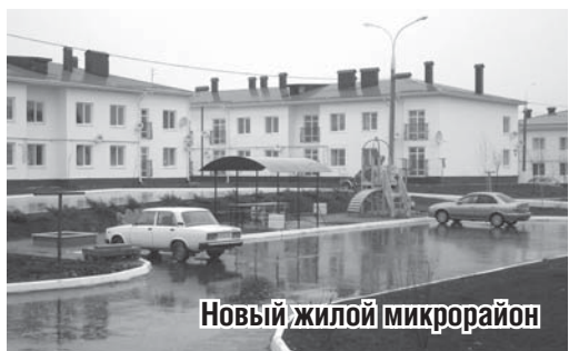
Новый жилой микрорайон