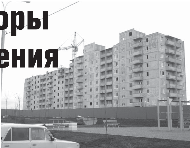
Этот дом начали строить в ноябре

Город приходит в себя. Люди решают личные проблемы. Им не до политики. Большинство из-