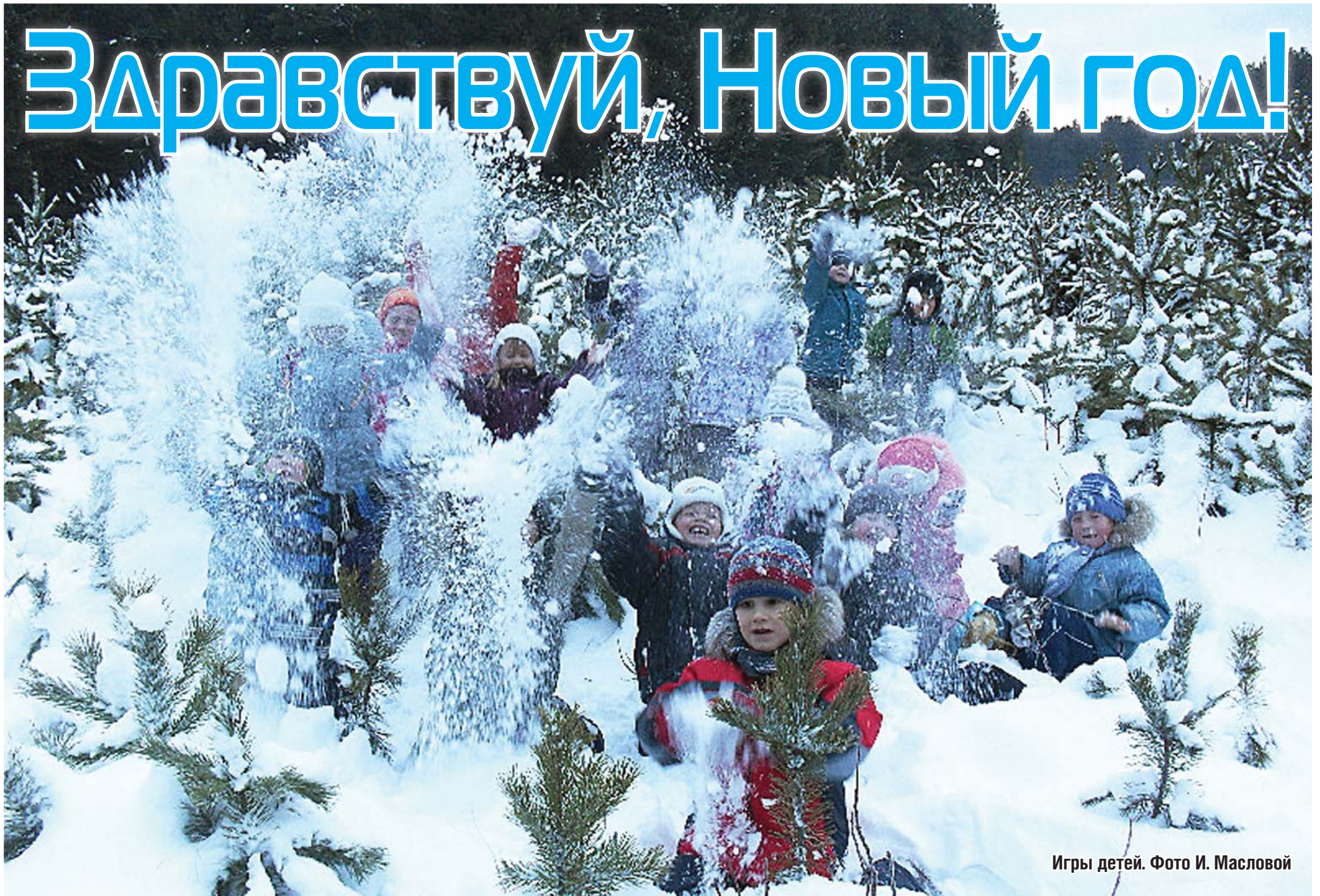
Игры детей.

Р едакция газеты «Маяк» рада поздравить земляков с наступающим Новым годом. Чтобы подарить Вам праздничное настроение, мы организовали конкурс «Зимняя сказка». Сегодня пора подвести его итоги. Откликнулись на конкурс 25 фотографов-любителей.