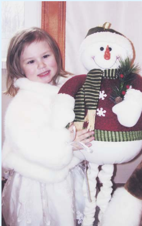
Только в Новый год можно играть прямо в доме со снеговиком, не задумываясь о том, что он может растаять.