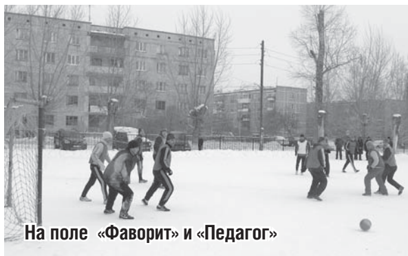
На поле «Фаворит» и «Педагог»

Наибольший интерес в шестом туре вызвал матч между лидером соревнований «Фаворитом» и чемпионом прошлого сезона «Педагогом». Несмотря на сильный мороз, на поле футболистам было жарко. Матч протекал с небольшим, но стойким преимуществом лидера соревнований. «Фаворит» победил со счетом 3:1.