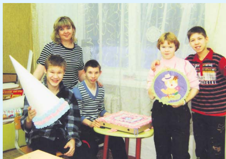
Ребята из клуба "Светлячок" детского дома п. Школьный к встрече Нового года готовы С. Дядькина