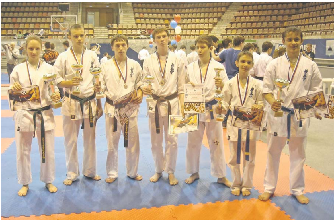
На снимке: победители из Сысертского городского округа.