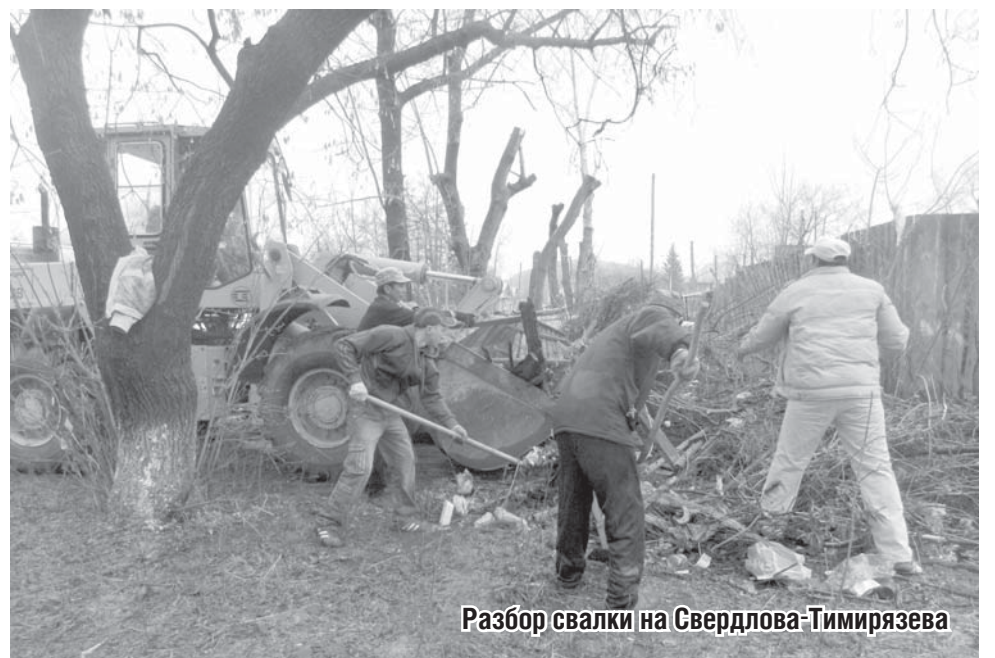
Разбор свалки на Свердлова-Тимирязева