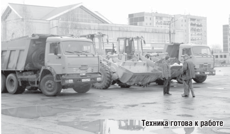
Техника готова к работе