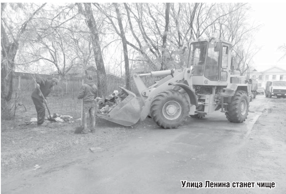
Улица Ленина станет чище