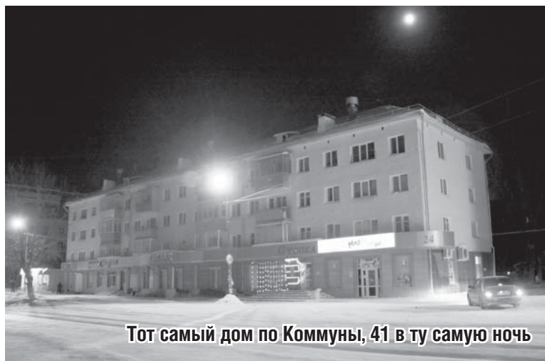
Тот самый дом по Коммуны, 41 в ту самую ночь