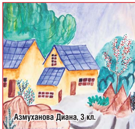
Азмуханова Диана, 3 кл.