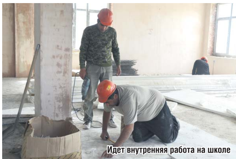
Идет внутренняя работа на школе

Коробка стоит, инженерные наружные сети готовы. Внутренние доделываются. Идет штукатурка, отделка, делаются перекрытия, стяжки. Степень го-