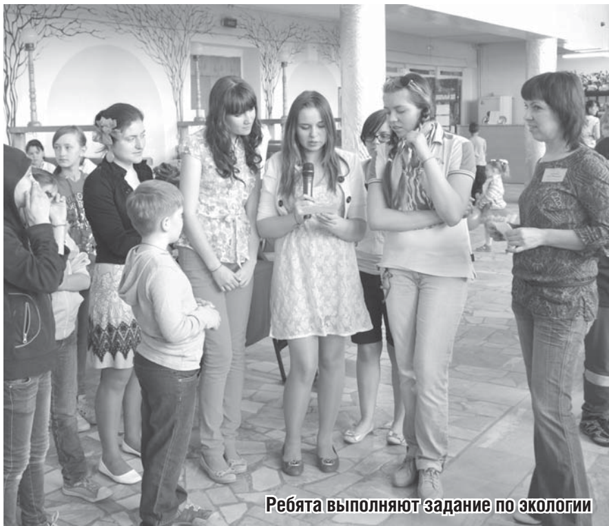
Ребята выполняют задание по экологии