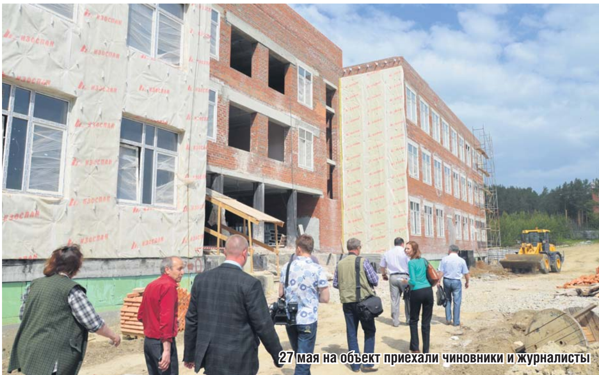
27 мая на объект приехали чиновники и журналисты

Осенью «Маяк» писал о том, что правоохранительные органы спустя пять лет заинтересовались, куда делись 10 млн, выделенные из бюджета в 2007 году. На выделенные деньги тогда купили материалы для стройки. Поскольку на этом финансирование остановилось (на объекте не было ни забора, ни сторожа), все хранилось у заказчика-застройщика. К 2012 году, когда возбудилась прокуратура, большая часть этих материалов была уже освоена на воз-