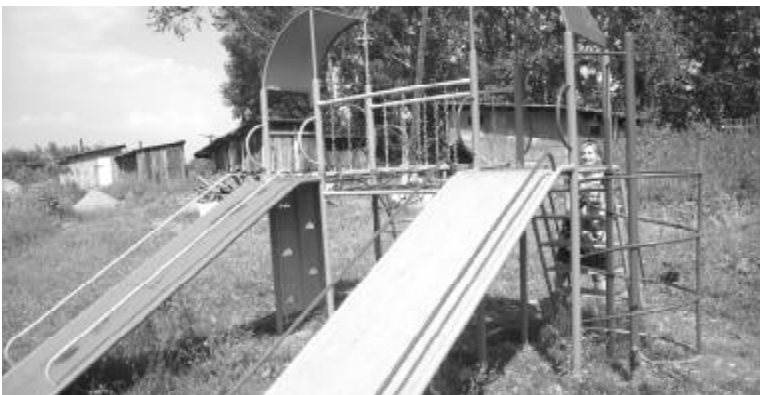
Вот такую красивую горку купил для малышей завод элементов трубопроводов;