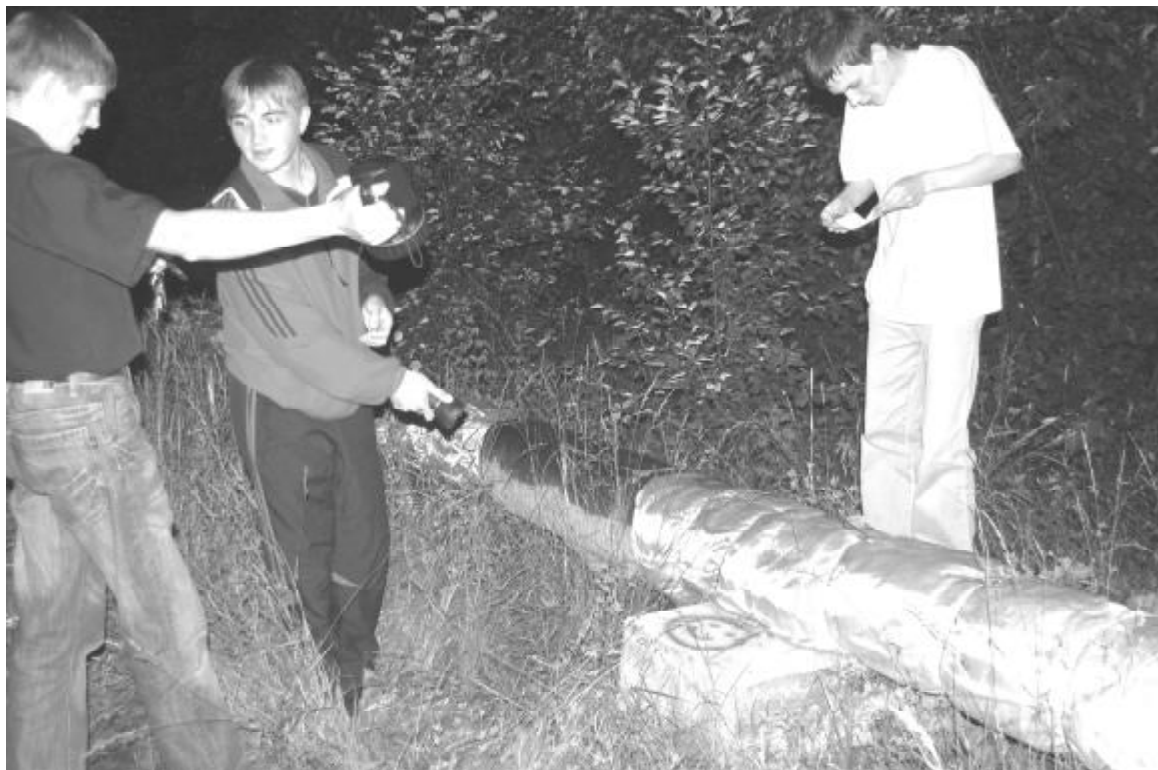
Команда нашла первый чек

Ночь. Свет фар сквозь туман. Нога сама давит на педаль газа. Ехать. Но куда? Есть задание, еще бы понять, что оно означает. Голова, измученная догадками, отказывается думать.