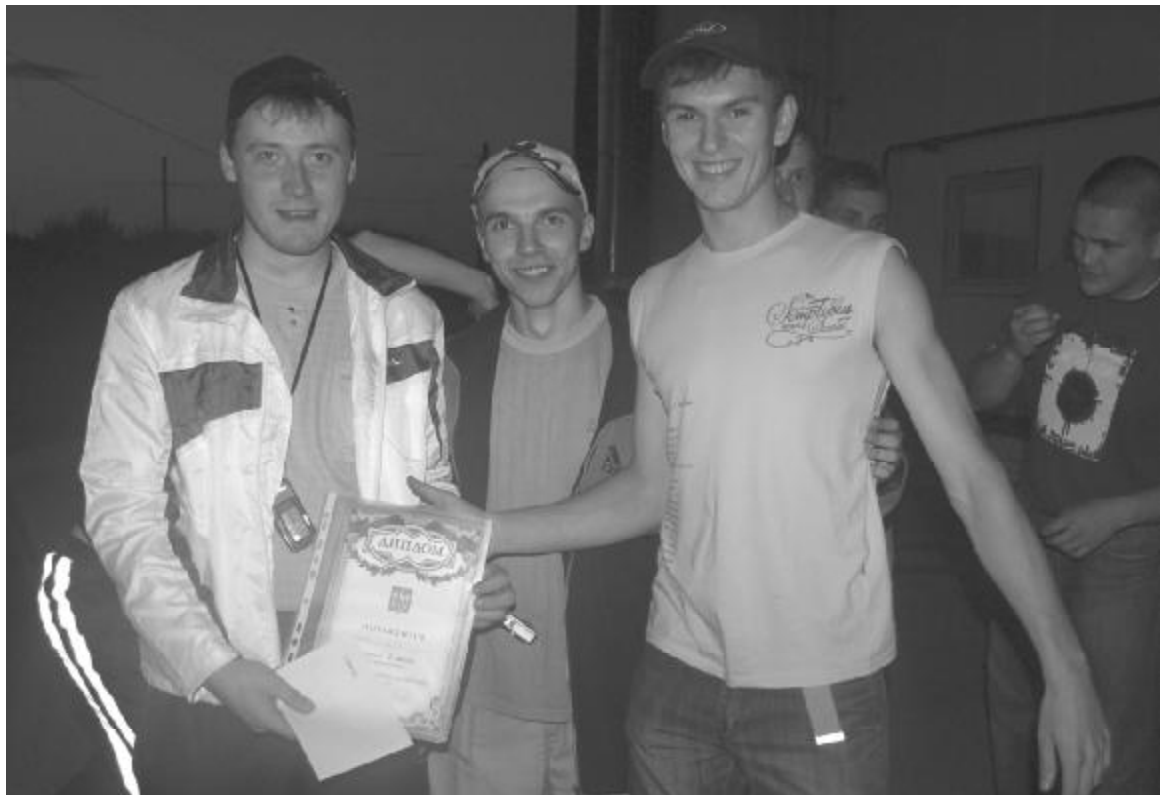
Победители гонок - команда "XXX"