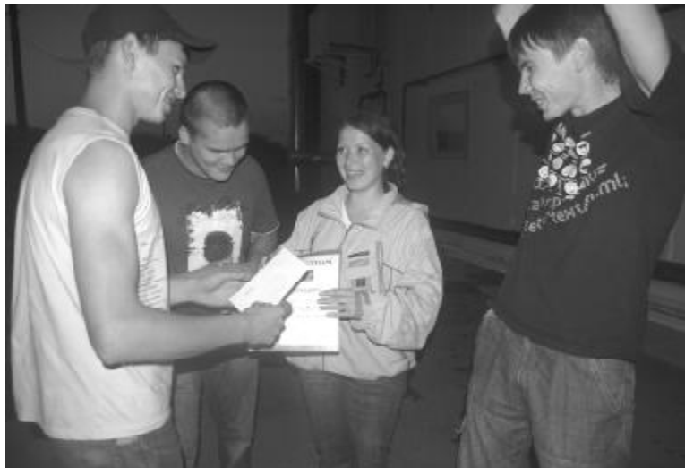
Диплом вручается команде "66" за третье место