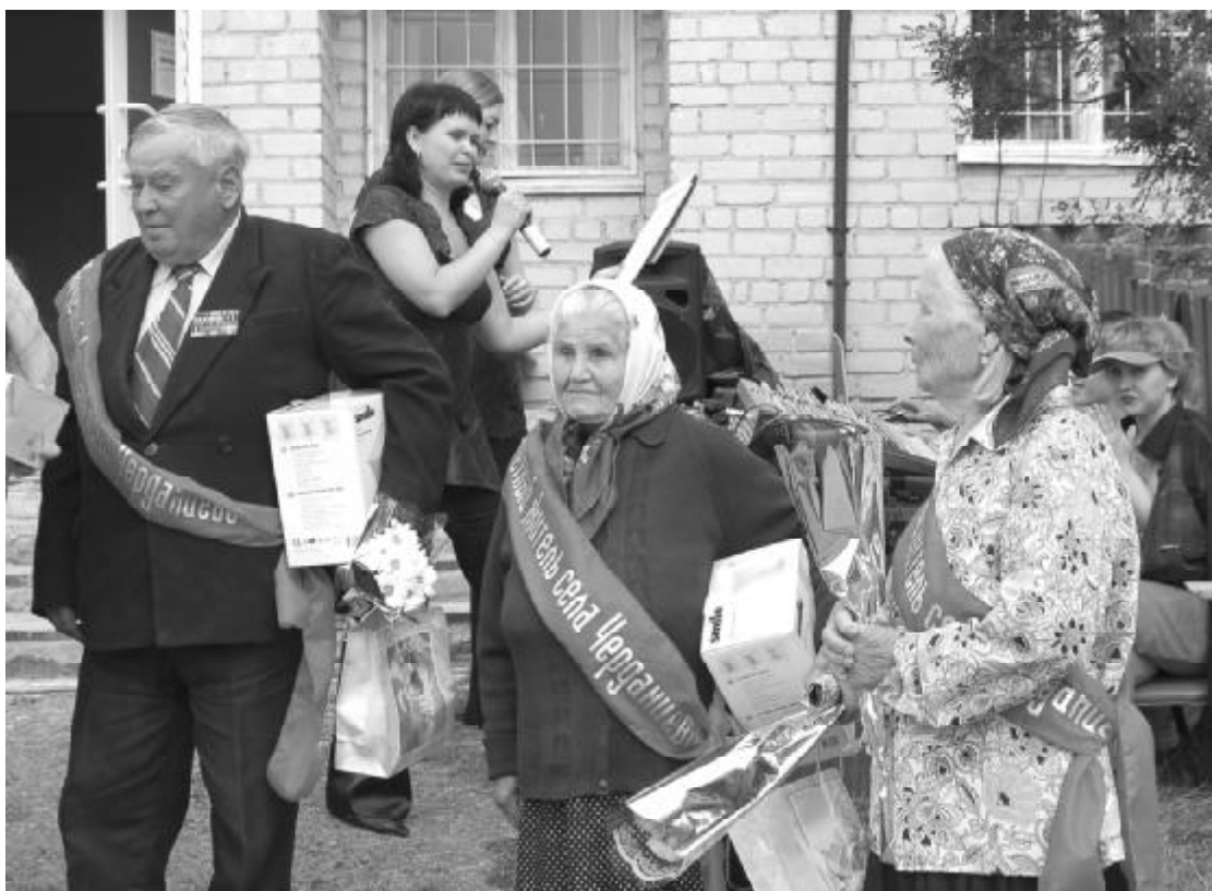
торым его моментам газета еще обязательно вернется.

Праздник продолжался долго (сельчане участвовали в развлекательных программах и спортивных мероприятиях, танцевали), и к неко-