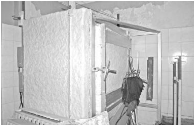
Печь для обжига почти готова