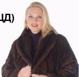
Весь товар сертифицирован.

В розницу по ОПТОВЫМ ЦЕНАМ * ШУБЫ (норка, овчина, нутрия, бобр и др.) * ДУБЛЕНКИ * ГОЛОВНЫЕ УБОРЫ, ВОРОТНИКИ * ДЕТСКИЕ ШУБКИ ШУБЫ (новая коллекция) НУТРИЯ от 5500 руб. Овчина – от 6500 руб. При покупке шубы свыше 20000 руб. - шапка 3200 руб. в подарок! (Акция до 30 сентября)