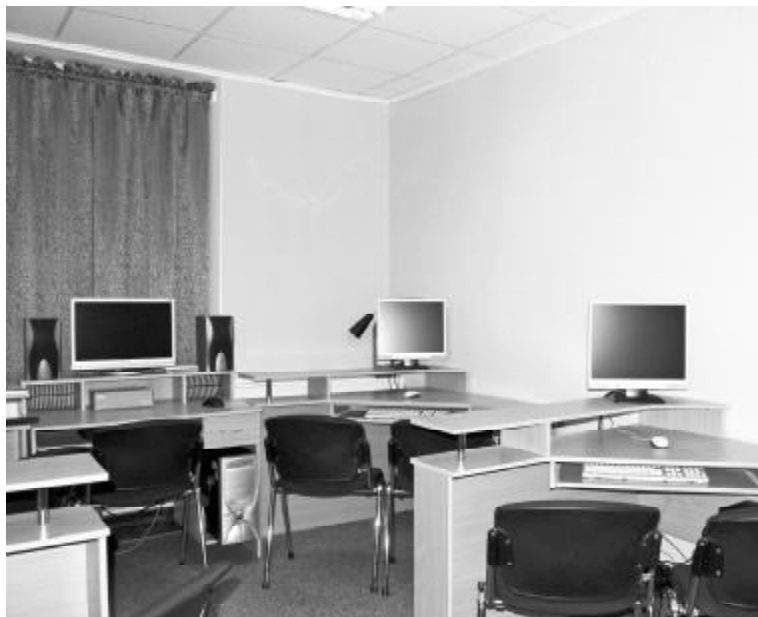
Совсем скоро в этом классе уроки компьютерной графики сысертским ребятам будет давать преподаватель архитектурной академии