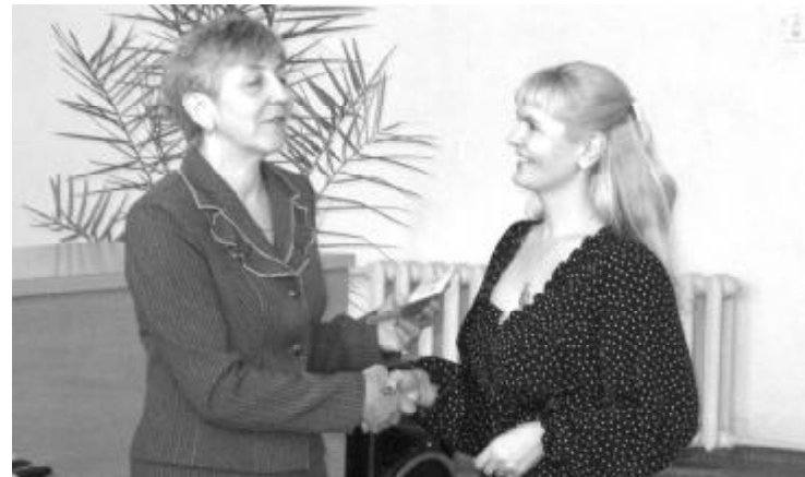
7 марта в Сысерти прошло вручение мандатов вновь избранным депутатам Думы Округа