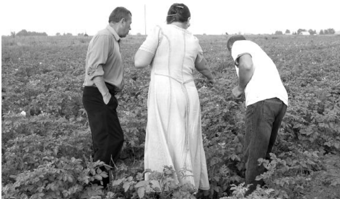
Ана картофеле – колорадский жук, – получили замечание щелкунцы

Продолжение в следующем номере «Маяка». Л. Рудакова.