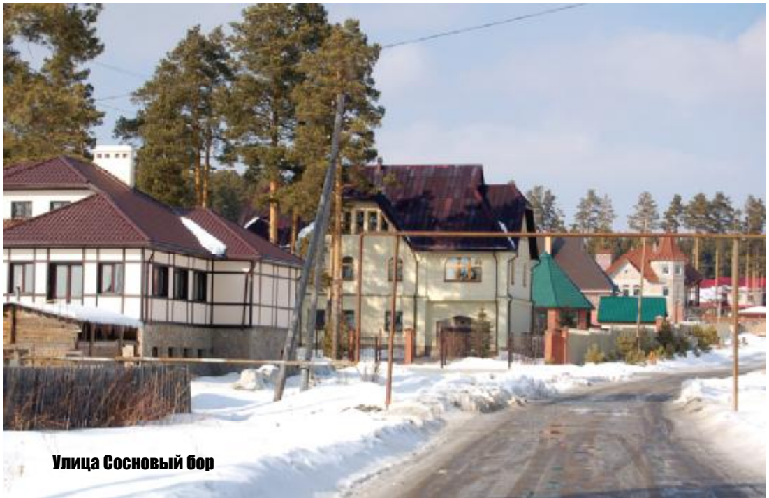
Улица Сосновый бор

И вот тут, от этого переулочка, начинается улица Рябиновая. Еду по ней и выезжаю прямо хонько к забору, на котором большими буквами написано: ул. Кремлевская. Так вот ты какая! Она пересекает улицы Рябиновую, Титова, Гагарина: тянется, по сути, по старой высоковольтке. На ней заканчивается улица Машиностроителей. И от нее, по-видимому, начинается улица Черемуховая. Которая заканчивается переулком Гранатовым. И сама Сысерть