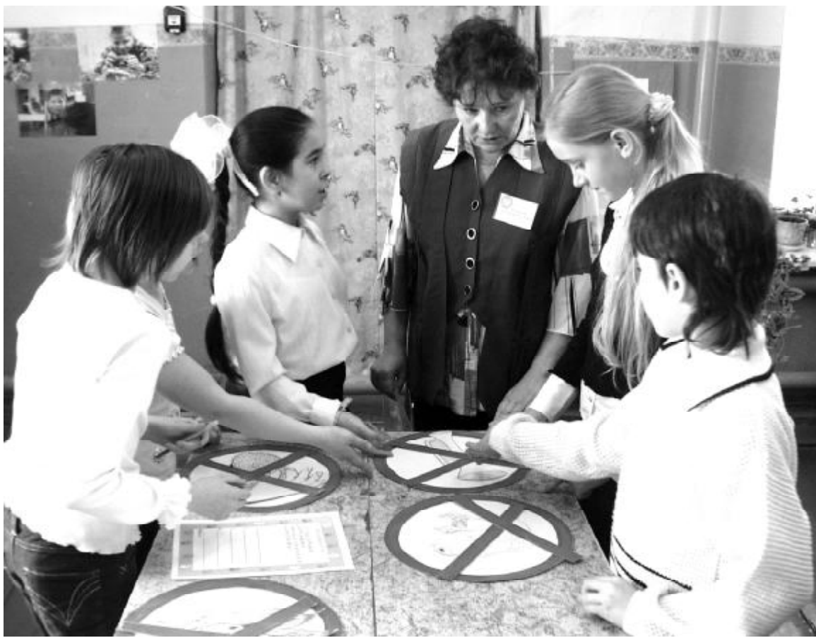
Юннаты на этапах интеллектуальной игры