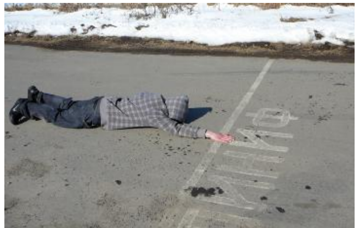
фото-команд. За третье место наградили «Воинов». Грамоту и приз получила команда «Второе дыхание». Видимо, ее название предопределило выход пусть не на первое, но все же на почетное второе место. И первым стал творческий коллектив «Фотоквартет» (хотя состоит он отнюдь не из четырех человек). Пятеро фотолюбителей, как и обладатели 2-го и 3-го мест, получили в подарок от организаторов полезные призы – книги по фототворчеству и не только.

В среду вечером 15 апреля в Центре детского технического творчества собрались юные фотографы и друзья Н. Г. Кичигина. Открылась выставка работ