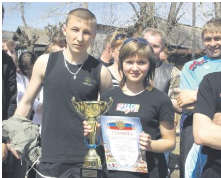
Старшеклассники Бобровского с кубком за 1 место