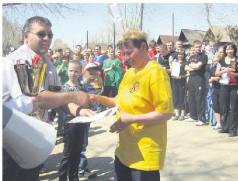
Кубок за 3 место вручается команде ветеранов «Карамышев»