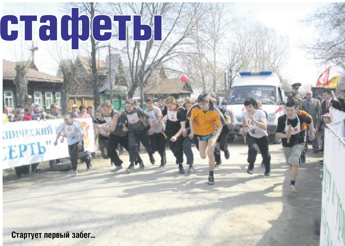
Стартует первый забег...