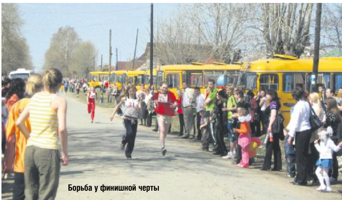
Борьба у финишной черты