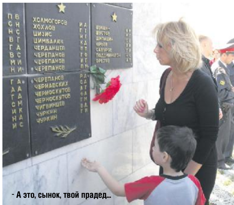
- А это, сынок, твой прадед...