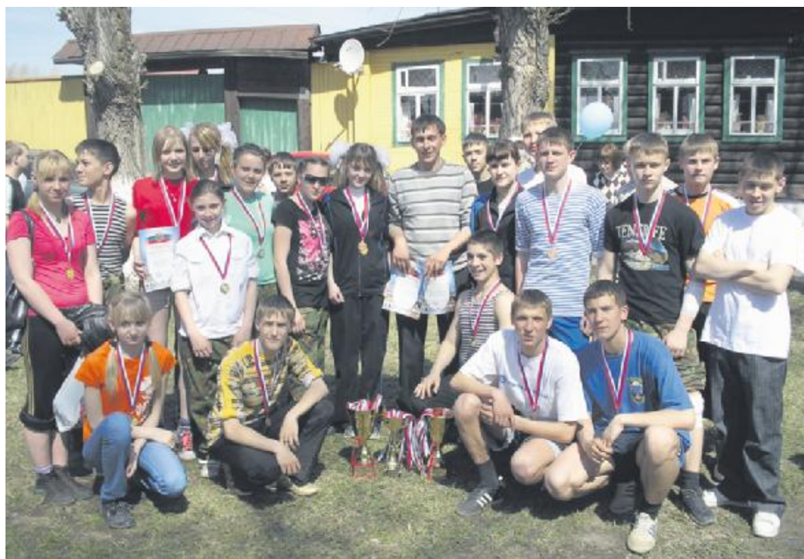
Кадеты собрали весь набор кубков и медалей – «золотой», «серебряный» и «бронзовый»