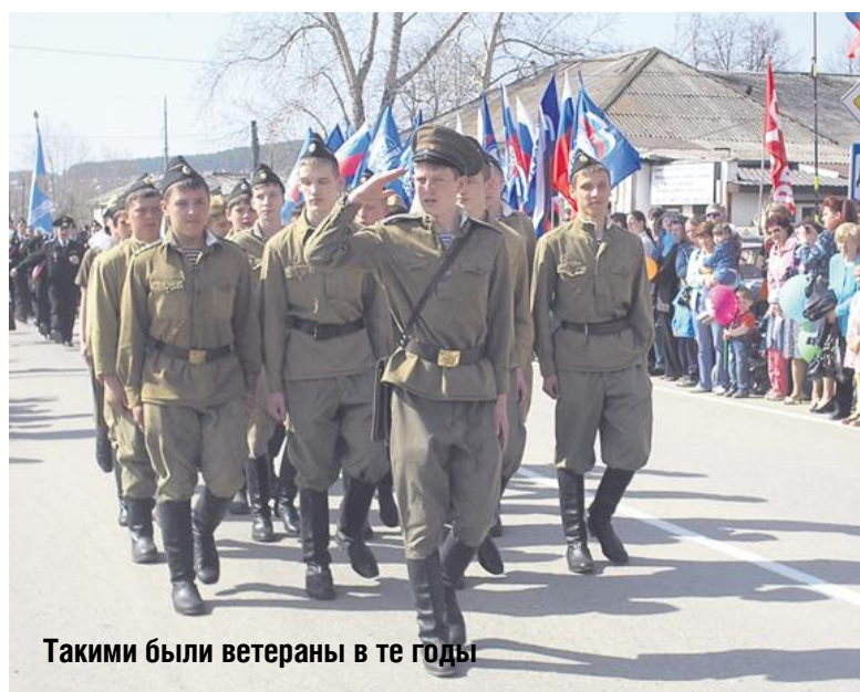
Таковыми были ветераны в те годы