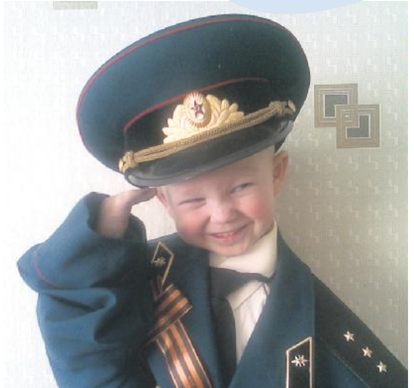
Сова Иван, 4 года, г. Сысерть

НАТЯЖНЫЕ ПОТОЛКИ из Франции - шикарно и недорого! (343) 290-38-11.