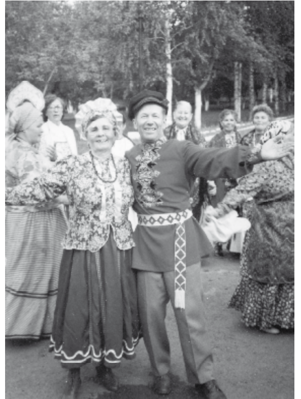
ходила пальчиками, Перед зрелыми людьми ходила белыми грудьюми.

Сейчас в центре поселка – красавец дом культуры! Но когда мы были молодыми, веселее было.