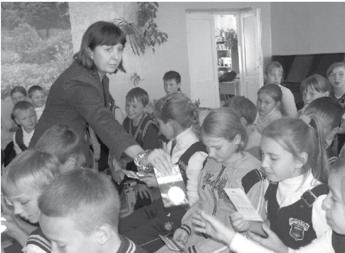
п. Б. Исток.