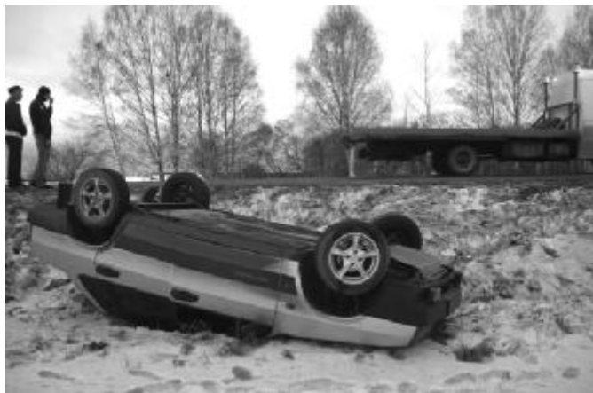
В результате ДТП водитель и пассажир автомобиля Тойота Аурис получили телесные повреждения различной степени тяжести.

Естественно, своим «водительским приемом» он помешал и обгоняемому автомобилю. Сказать «помешал» – не сказать ничего. Водитель «девятиной» растерялся и тоже сделал лишнее движение. В считанные секунды и он оказался за пределами дорожного полотна «вверх тормашками».