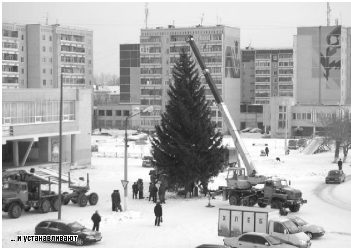
... и устанавливают

Ближится новый 2010 год и всем интересно, что нас ожидает. Вы можете немного заглянуть в будущее и узнать прогноз, который касается работы и финансов.