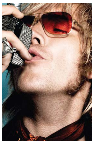
THE BOAT THAT ROCKED

Малоснежное уральское лето вновь вступило в свои права, то и дело забирая у нас теплые деньки и ласковое солнышко. Так ведь недолго и загрустить, и замерзнуть! Поэтому срочно согреваемся просмотром убойной музыкальной комедии, появившейся на свет прошлым летом. Это, конечно же, «Рок-волна», Ричарда Кёртиса. На киноэкран врываются взрывные 60-е с их «запретной» музыкой, борьбой за свободу и бесконечным позитивом! Действие фильма разворачивается на корабле в Северном море, где 8 видеоев день и ночь передают на всю округу лучшую рок-музыку. Естественно, запретную. Естественно, этих «пиратов» хотят поймать и убрать с глаз долой, от ушей еще дальше. И естественно у злых чиновников ничего не получится. Зато мы, зрители, получим море смешных диалогов, океан лучшей музыки и уж точно не замерзнем. Так что, кто не смотрел – видеть и слышать. Кто смотрел – повторить и зарядиться позитивом. Возражения не принимаются!