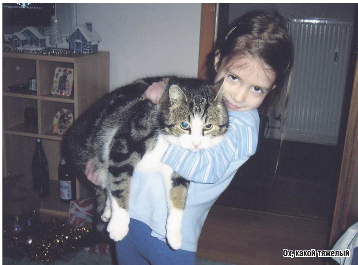
Ох, какой тяжелый