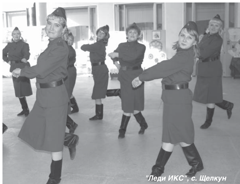
"Леди ИКС", с. Щелкун