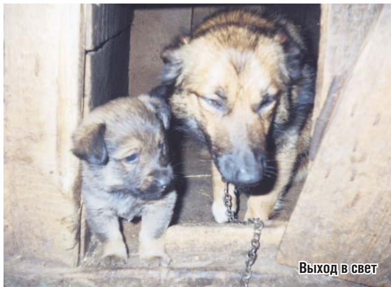
Выход в свет

Победителей ждут призы. Спонсор конкурса – Ветеринарная аптека, что по ул. Р. Люксембург, 60 в Сысерти.