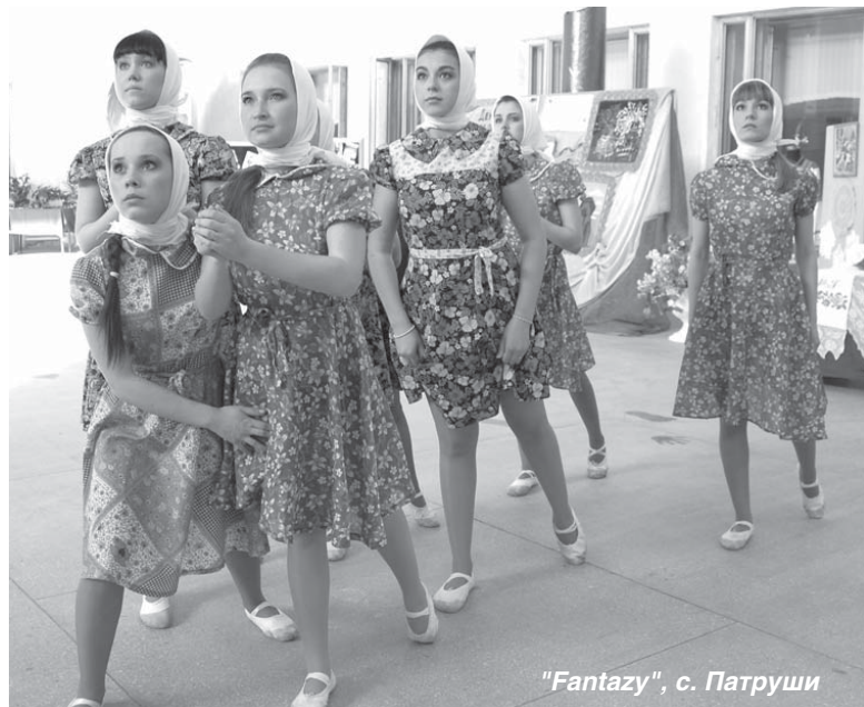
"Fantazy", с. Патруши