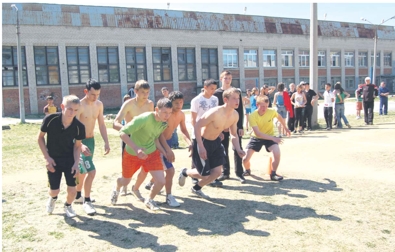
В субботу, 15 мая, на спортплощадке школы №23 прошли традиционные соревнования школьников по легкоатлетическому многоборью «Шиповка юных».