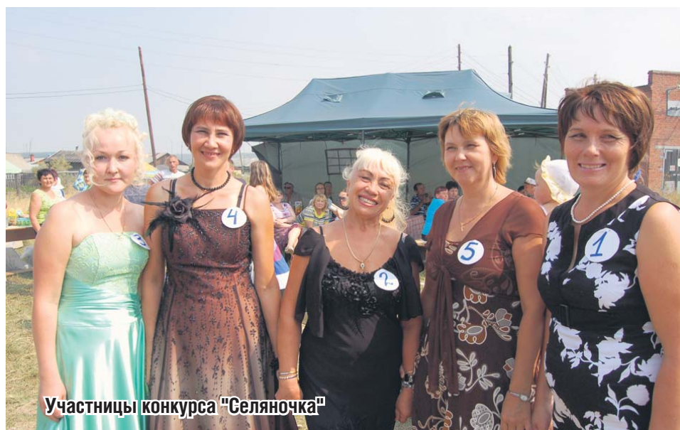
Участницы конкурса «Селяночка»