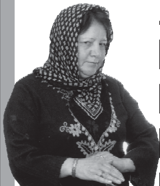
СНИМАЕТ ПОРЧУ ЛИЧНО И ПО ФОТО

Будет организована продажа пособий и амулетов.