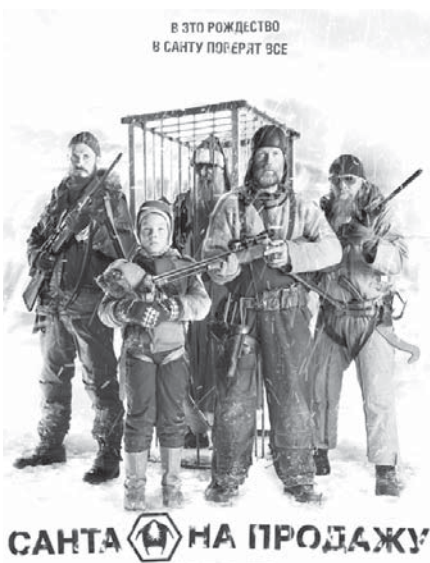
САНТА НА ПРОДАЖУ

Порою кажется, что новогодним праздникам уделяют слишком внимания и от этого теряется ощущение чуда. Однако от этого фильма вы уйдете (если рискне-