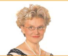
Елена Малышева Ведущая программы "Здоровье"