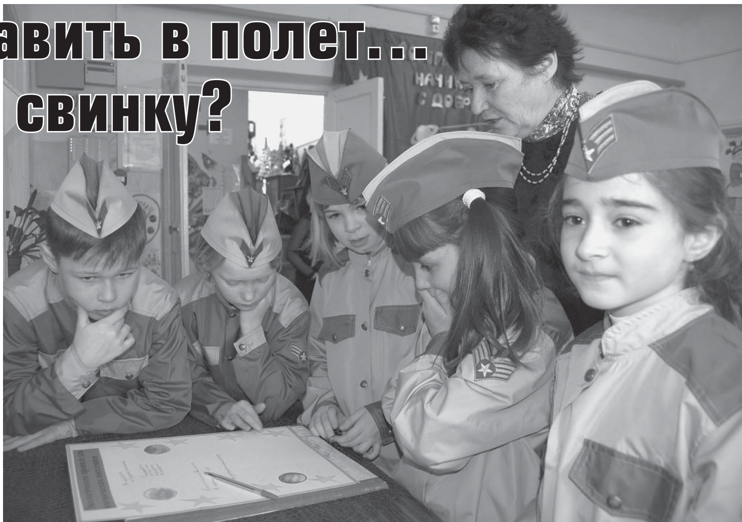
На снимке: команда «Космические биологи» из Большого Истока со своим руководителем.