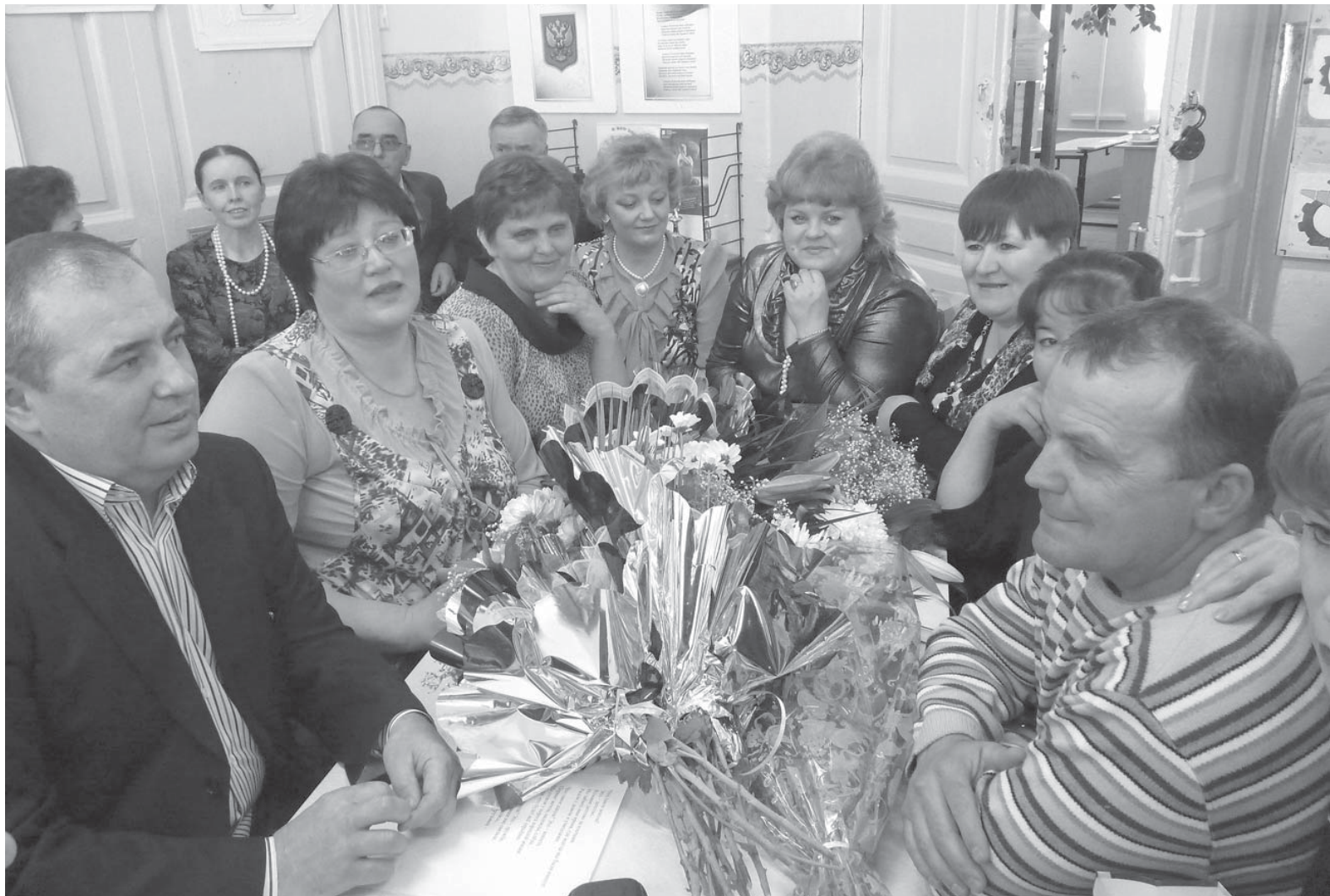
(Материал читайте на 5 стр.)