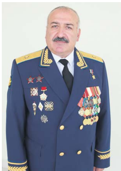
Председатель регионального отделения ДОСААФ РОССИИ Свердловской области, герой Российской Федерации, генерал-майор Исаханян Г. А.

В соответствии с государственным оборонным заказом